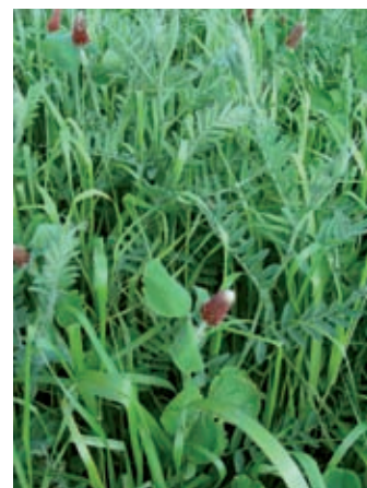
SIVIERO associé à du trèfle Incarnat + vesce